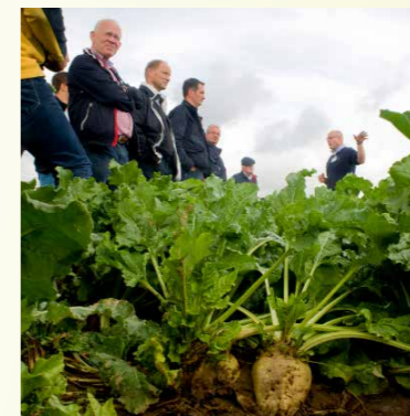
LTO Akkerbouw stimuleert kennisoverdracht door ledenavonden, demo-projecten en het verbeteren van onderwijs

LTO Akkerbouw ondersteunt projecten op het gebied van bodemgezondheid, kringloop en nutriënten. Bij beleidsmakers dringen we aan op meer ruimte voor bodemverbeterende maatregelen (zoals rustgewassen en betere mest) en voor betere samenwerking met de melkveehouderij.