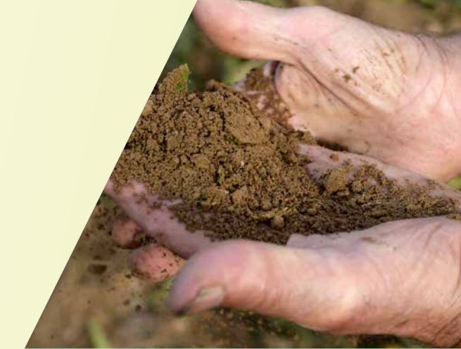
Bodemkwaliteit, een belangrijke factor voor het succes van de Nederlandse akkerbouw