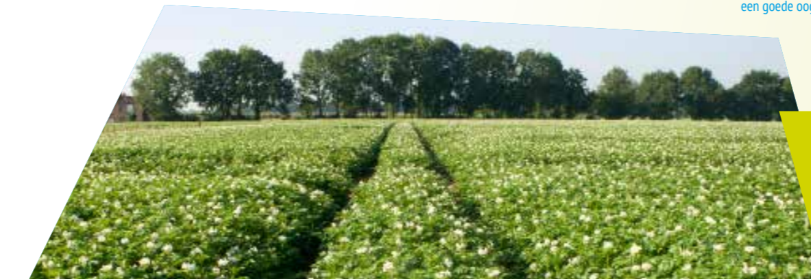
Gezonde planten zijn de basis voor een goede oogst