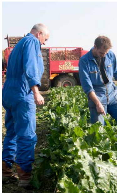
LTO Akkerbouw maakt zich hard voor de beschikbaarheid van goede en betaalbare arbeid

> We laten een duidelijke stem horen binnen LTO Nederland en willen dat de sector de beste kennis heeft om optimaal te kunnen presteren en dat de consument weet hoe wij een eerlijk, Nederlands product telen.